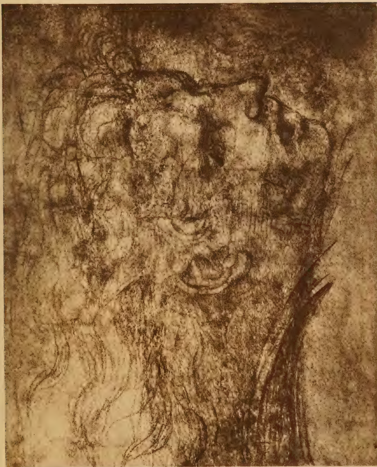
Tête de l'Ange vengeur de l'Eliodore